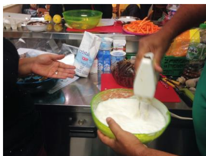
Activité ANP- 2015 à la Bourdonnette

C'est une occasion pour tous de donner et de recevoir sans contrainte, elle favorise le contact entre familles arrivantes et familles ancrées dans le canton en provenance ou non des mêmes contrées mais surtout parlant une langue commune.